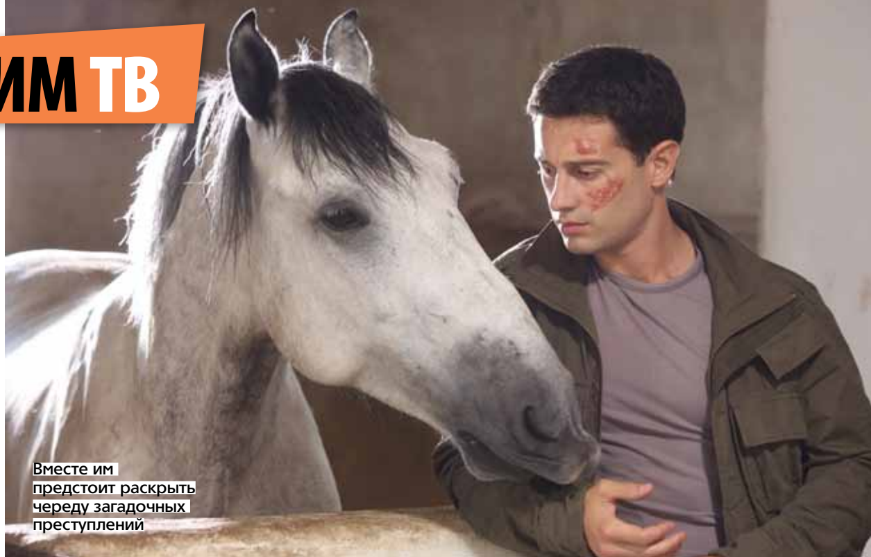
Вместе им предстоит раскрыть череду загадочных преступлений

КАНАЛ «РОССИЯ» НАЧИНАЕТ ПОКАЗ НОВОГО СЕРИАЛА «ГРОМ». АНТОН МАКАРСКИЙ РАССКАЗАЛ «СТАРХИТУ» О ТОМ, КАК НАЙТИ ПОДХОД К ЖЕРЕБЦУ.